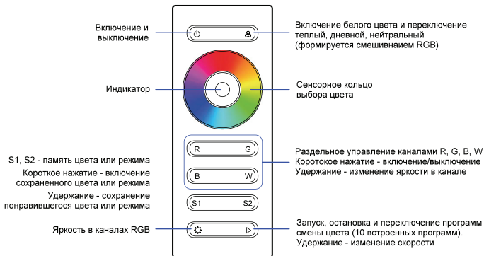
Рис.2. Назначение кнопок на пульте ДУ.